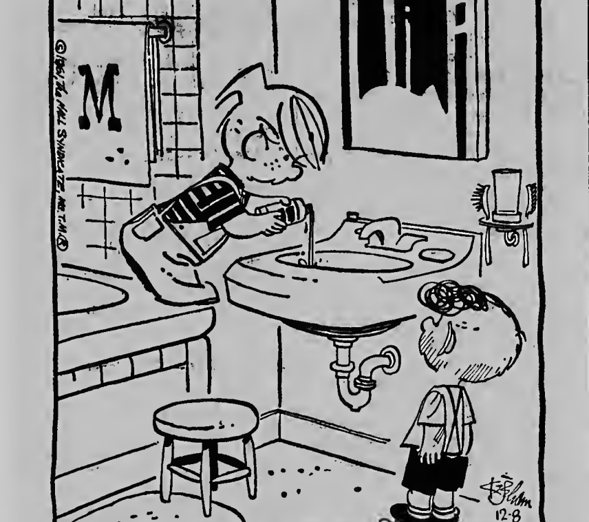
"SURE! THERE'S NOTHING LIKE CASTOR OIL FOR FIXIN' UP DRAIN PIPES!" "Quere mi, no tin nada mas bon cu carpeta pa basha den e tubo equi!"